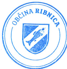
Samo Pogorelec Župan